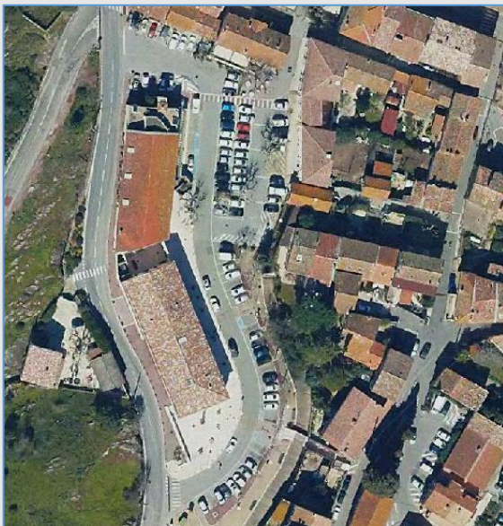
Place Germain Ollier / parking du jardin des Artichauts