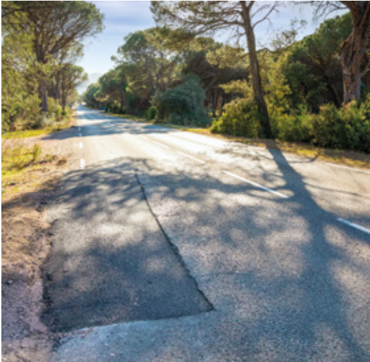
VOIRIE - Travaux de purge (enlèvement de racines à l'origine de déformations de chaussées et reprise en enrobé). Avenue des Eucalyptus et Route de la Bouverie.