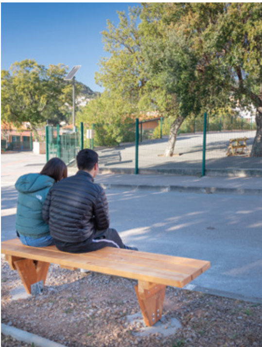
ÉCOLE ÉLÉMENTAIRE Fourniture et pose de bancs au niveau des entrées.