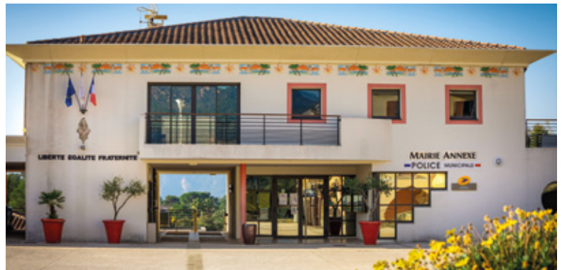
POSTE DE LA BOUVERIE Fourniture et pose d'un système de vidéoprotection suite au transfert du bureau de Poste.