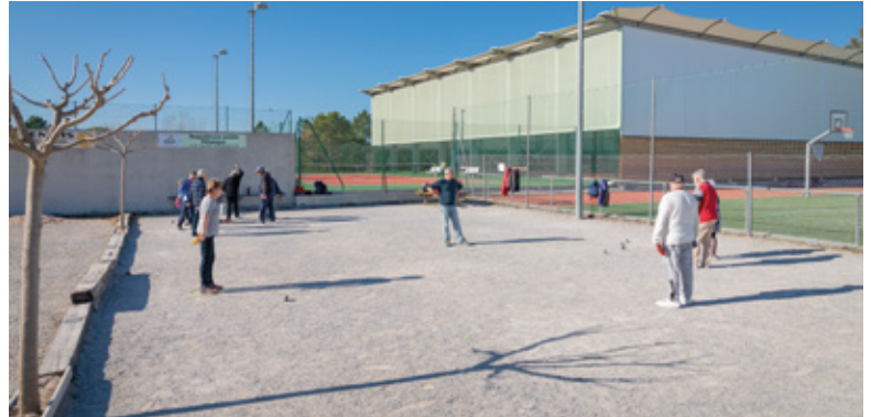
BOULODROME ESPACE JACQUES CALANDRI Réfection en Régie Municipale de la surface de jeu avec apport de gravier adapté et mise en forme.