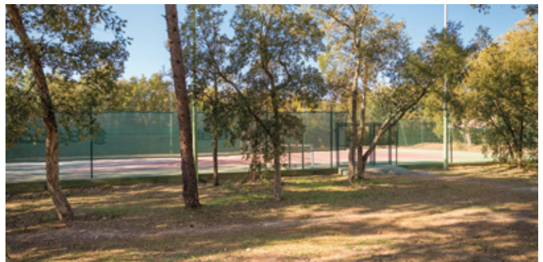
TENNIS DES PINS PARASOLS Travaux d'élagage autour du terrain de tennis.